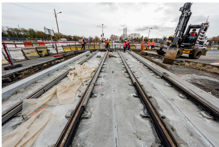
Premiers rails posés sur le carrefour de la RD445 à Viry-Chatillon - Novembre 2020