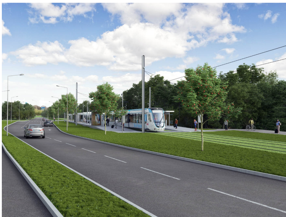
Perspective de la station Traité de Rome à Évry-Courcouronnes (intention d'aménagement)