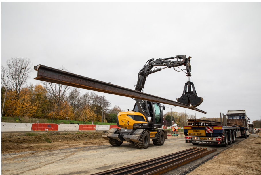
Déchargement des rails boulevard Jean Monnet à Évry-Courcouronnes – Novembre 2020