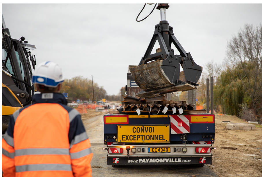
Livraison des rails boulevard Jean Monnet à Évry-Courcouronnes – Novembre 2020

Sur l'ensemble de la ligne, les rails seront installés au fur et à mesure de l'avancement des travaux de construction de la plateforme du tramway.