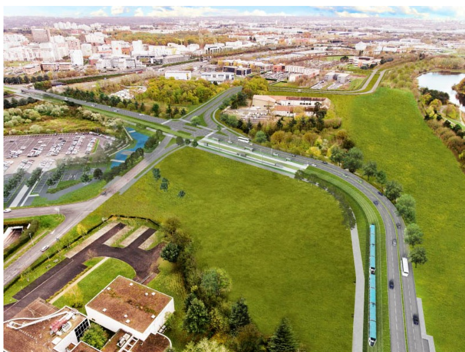
Perspective de la station Bois Briard à Évry-Courcouronnes (intention d'aménagement)