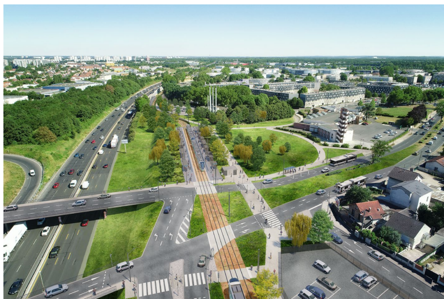
Perspective de la station Amédée Gordini à Viry-Chatillon (intention d'aménagement)

À Évry-Courcouronnes , les travaux de pose des rails ont démarré mi-novembre au rond-point du Traité de Rome en direction du boulevard Jean Monnet, le long du canal. Ils se poursuivront progressivement jusqu'à rejoindre le centre d'Évry-Courcouronnes au printemps 2021.