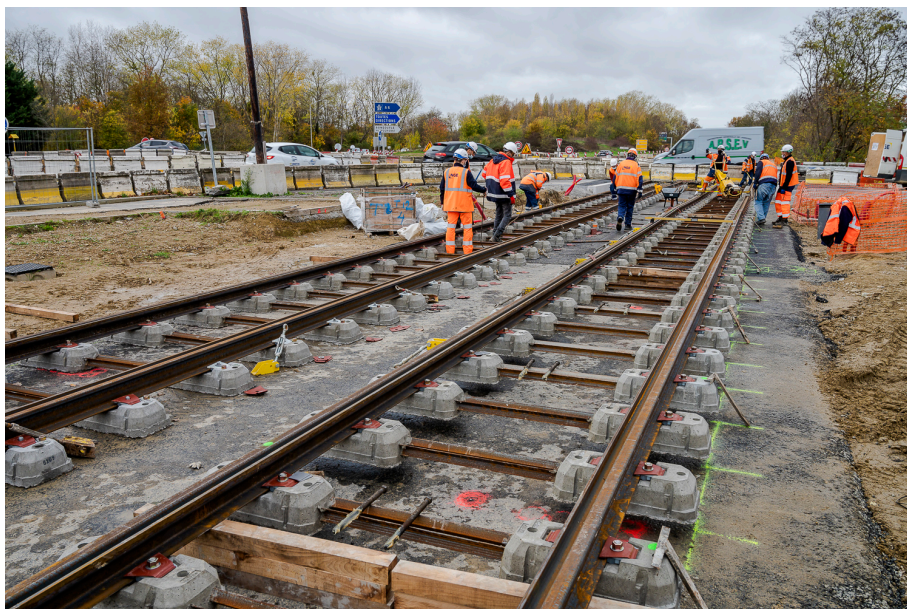
Installation des rails boulevard Jean Monnet à Évry-Courcouronnes – Novembre 2020