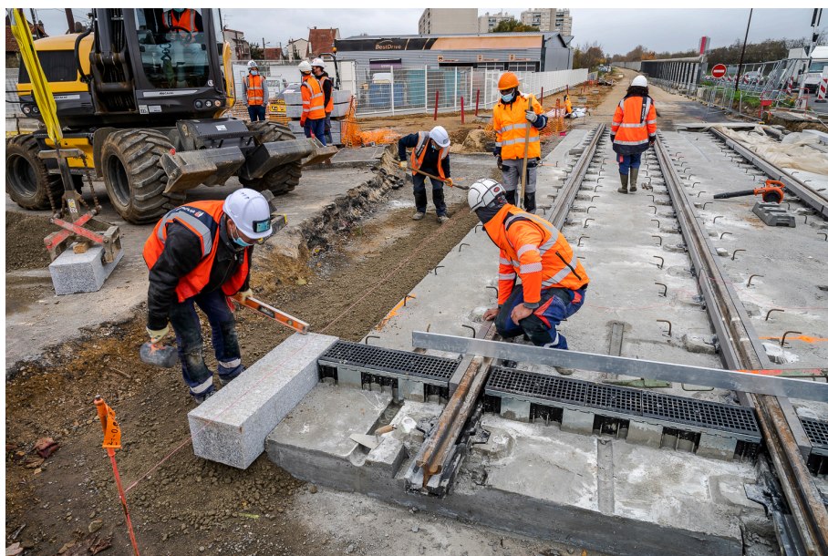
Premiers rails posés sur le carrefour de la RD445 à Viry-Chatillon - Novembre 2020