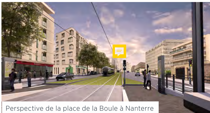
Perspective de la place de la Boule à Nanterre

Porté par IDFM, le département Hauts-de-Seine et la région Île-de-France, le projet de prolongement du Tram 1 aborde dès mi-septembre une nouvelle étape : l'enquête publique. Son organisation est confiée au Préfet des Hauts-de-Seine. Elle se déroule sur les communes de Colombes, Nanterre, et Rueil-Malmaison.