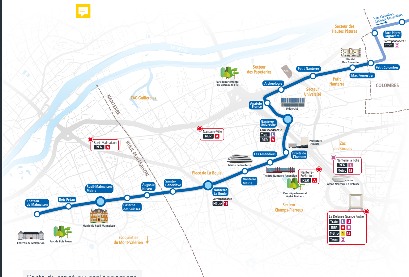
Carte du tracé du prolongement

Le projet prévoit de relier le quartier du Petit Colombes au Château de Malmaison, en desservant les territoires de Nanterre et de Rueil-Malmaison. Au total, ce sont 15 stations supplémentaires – espacées de 500 mètres environ, sur un parcours de 7,5 km - qui seront aménagées afin de répondre aux besoins en déplacement du territoire. En correspondance avec le RER A et le Train L à la gare de Nanterre-Université et avec le futur métro 15 à la place de la Boule à Nanterre, le projet facilitera les déplacements des habitants et améliorera l'accès à de nombreux équipements majeurs de l'ouest francilien.