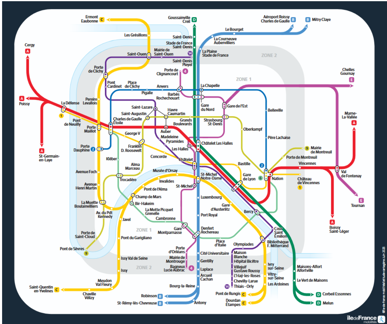
Plan des lignes et stations de métro et RER ouvertes la nuit de la Fête de la Musique