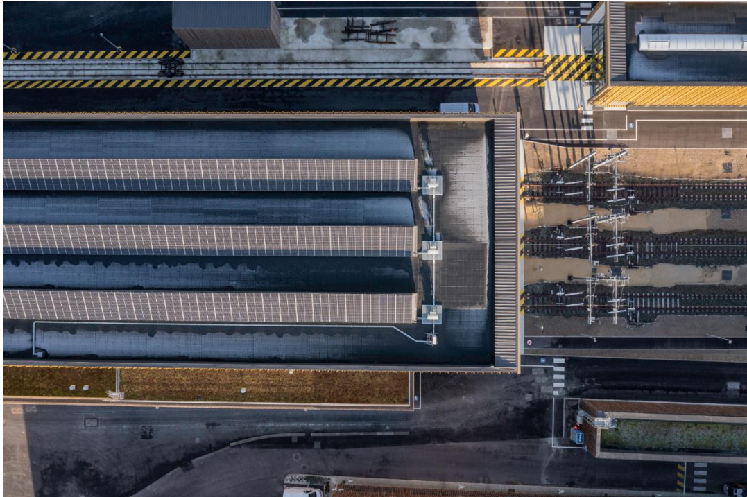
Nouveau Technicentre Val Notre Dame – Ligne J – Panneaux photovoltaïques