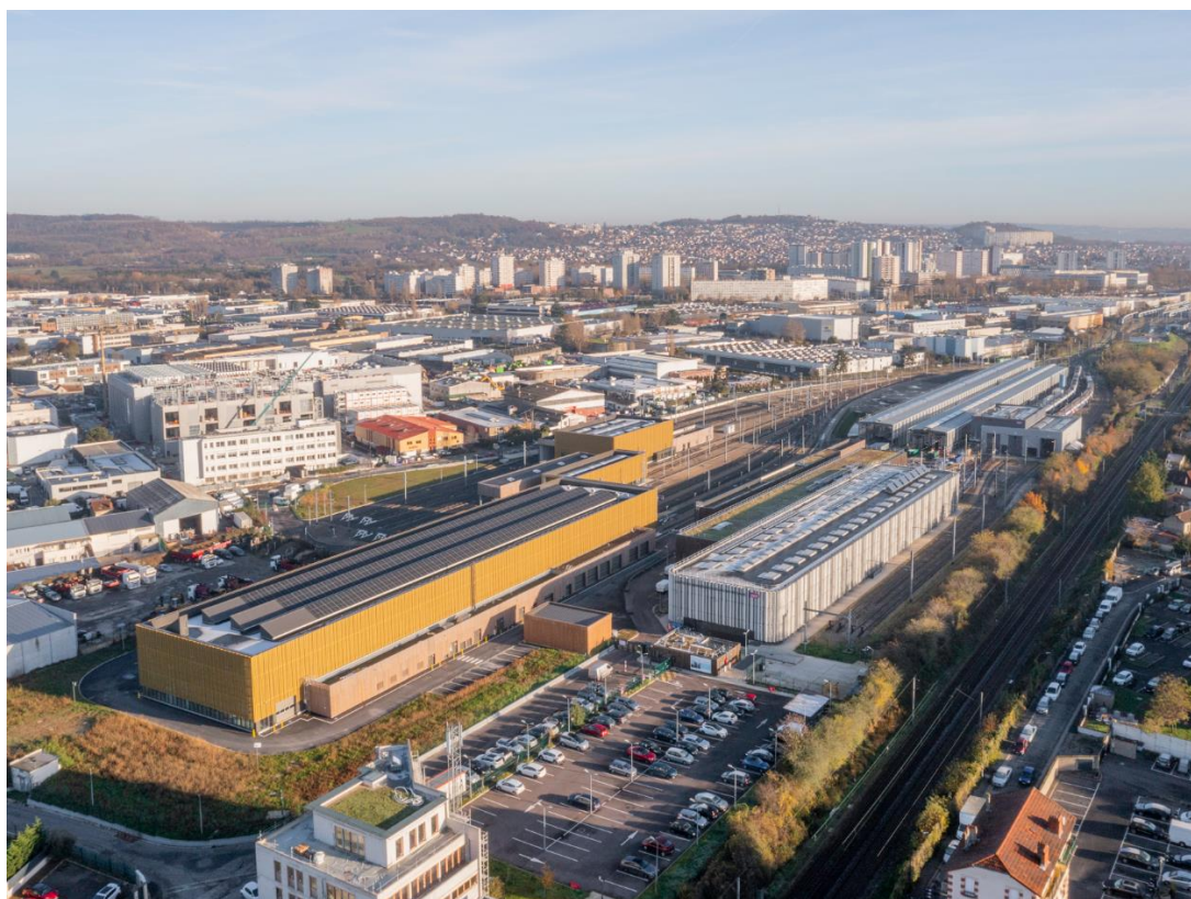
Nouveau Technicentre Val Notre Dame – Ligne J

Empruntée par plus de 260 000 voyageurs chaque jour, la ligne J est une ligne importante dans la desserte du Val d'Oise et des Yvelines depuis Paris Saint-Lazare. Afin d'offrir une plus grande fiabilité et une plus grande performance des trains de la ligne, Île-de-France Mobilités a financé, pour plus de 200 millions d'euros, le nouveau Technicentre Val Notre-Dame, construit par SNCF Voyageurs. Ce nouveau Technicentre contribuera à une meilleure qualité de service, à plus de fiabilité et à une ponctualité accrue aux bénéfices des tous les voyageurs de la ligne J.