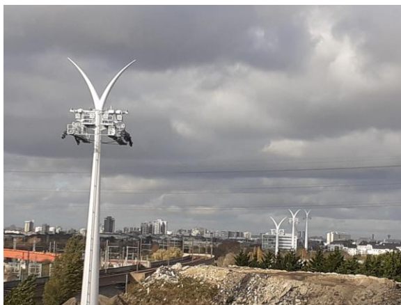
© Ile-de-France Mobilités – La ligne du C1 se dessine