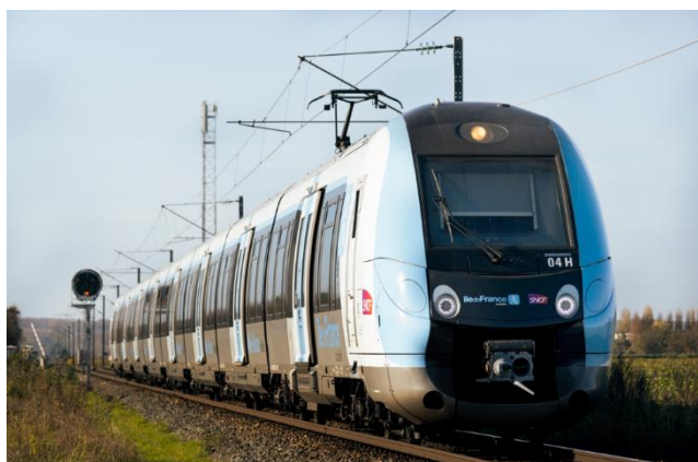
Le Francilien