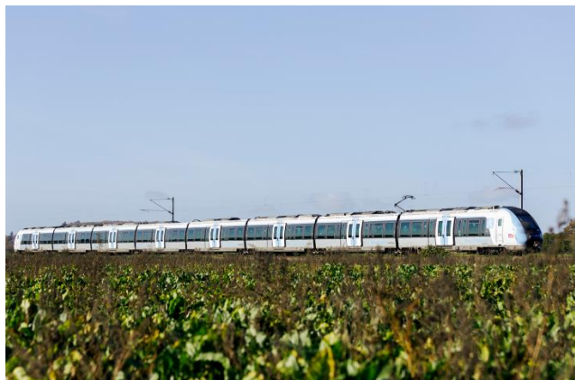
Francilien – Ligne P