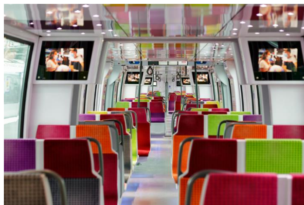
Le Francilien