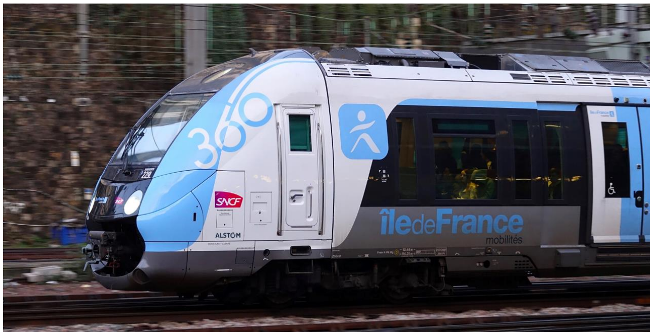
Le Francilien – 360 ème et dernière rame

Ce vendredi 9 décembre marque la fin du déploiement du Francilien sur les lignes L, J, H, K, P et RER E. Le Francilien est le train nouvelle génération spécialement conçu pour les lignes régionales d'Île-de-France en zone dense opérées par Transilien SNCF pour le compte d'Île-de-France Mobilités. Développé et construit par Alstom (ex Bombardier) à Crespin, le Francilien aura mobilisé des centaines d'ingénieurs, de cheminots et d'agents SNCF pendant plus de 16 années pour en faire l'un des trains les plus fiables de toute l'Île-de-France. A sa première mise en service sur la Ligne H en 2009, le Francilien a marqué un saut technologique en remplaçant les anciennes rames iconiques de banlieue, en particulier les « Petit Gris » et rames RIB/RIO conçues dans les années soixante. Dès lors, le Francilien ne cessera d'être plébiscité par les voyageurs franciliens sur les lignes de Paris Nord, Paris Saint-Lazare et Paris Est.