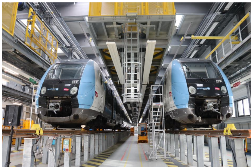
Technicentre Val Notre Dame Demain phase 1 – Ligne J – Atelier 3 voies

La phase 1 du projet Val Notre Dame Demain financée par Île-de-France Mobilités pour la réalisation de :