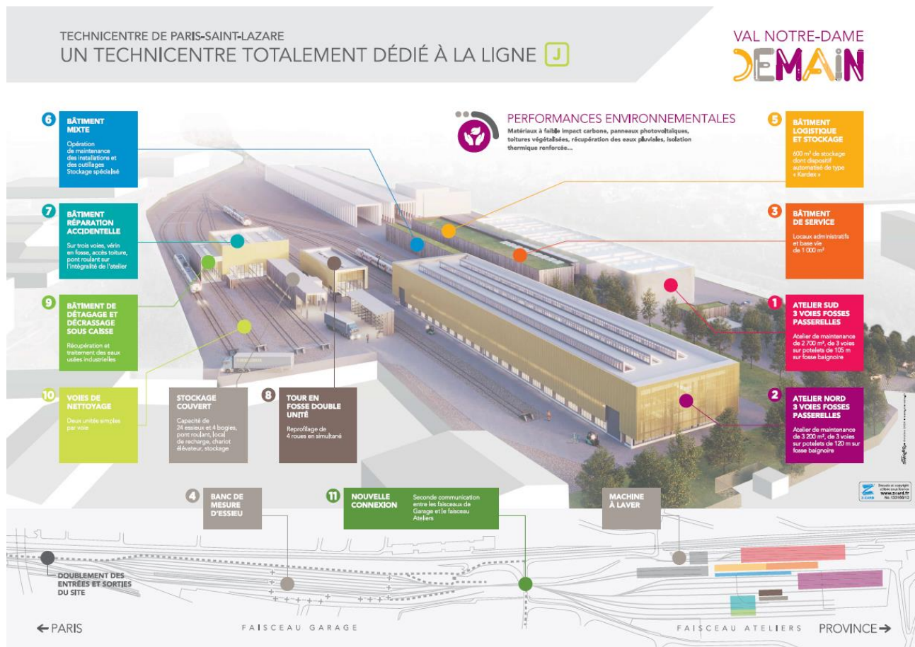
Technicentre Val Notre Dame Demain phases 1 et 2 – Ligne J – Transilien SNCF

Le phase 2 de Val Notre Dame Demain sera livrée à l'horizon fin 2024.